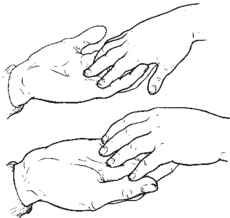
Figura 2. Las manos del maestro están por debajo – a la disposición del niño para que él las use como herramientas.

Antes de que un niño aprenda a usar sus manos como herramientas confiables, frecuentemente utilizará y confiará en las manos de otra persona. La mayoría de las personas han visto a un niño pequeño acercarse a la mano de un adulto y colocarla sobre un objeto que él quiere que sea manipulado. Para que un niño que es sordo y ciego pueda hacer esto, las manos del adulto tienen que estar disponibles para su uso. Sin visión, esta disponibilidad debe experimentarse por medio del tacto. Yo he descubierto que el gesto más efectivo es usualmente colocar mis